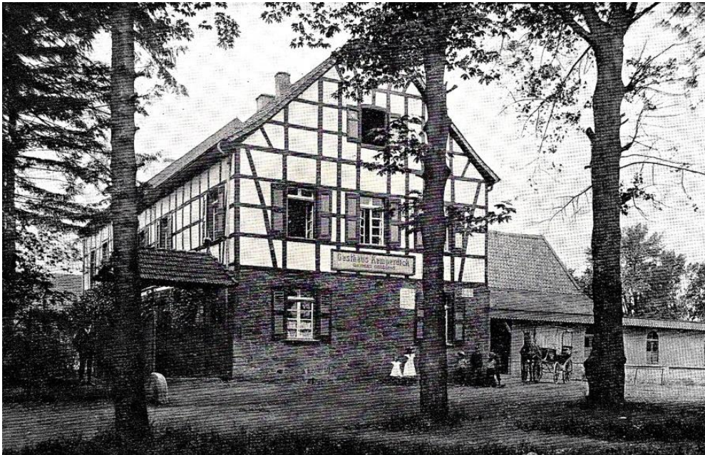
Abbildung 2: Gasthof Kemperdick um 1900. Aus: Erkrath, Verkehrs- und Verschönerungsverein für die Bürgermeisterei Erkrath, 1914

Sicher ist, dass das Epitaph nicht das Grab des Amtsjägers Schlömer deckte. Schlömer wurde nicht im Kemperdicker Garten begraben, sondern in Hilden. Der alte Grabstein wurde wohl nach 1803 versetzt, nachdem durch landesherrlichem Gesetz die bis dahin übliche Bestattung auf den alten, innerhalb der Gemeinden, meist rund um die Pfarrkirchen liegenden Friedhöfe verboten wurde und die alten Gruften aufgegeben und aufgelöst werden mussten. Zwischen den Familien Kemperdick und Schlömer bestehende, mehrfache eheliche Verbindungen werden einen Nachkommen der Familie Kemperdick veranlasst haben, den Stein zu versetzen und damit zu erhalten.