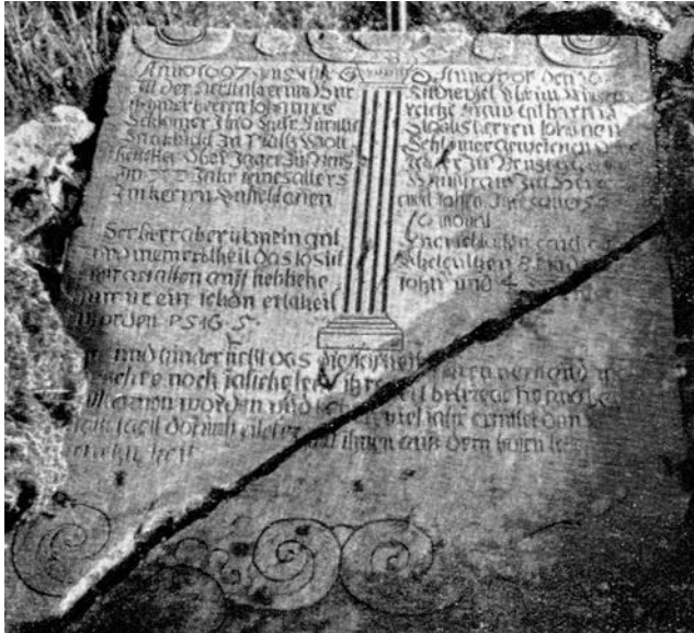
Abbildung 4: H. Strangmeier, Der Grabstein des Ehepaares Schlömer aus Hilden, in: Hildener Jahrbuch 52/1947