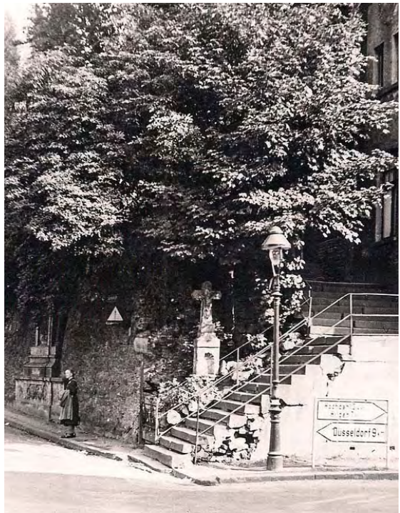
Wegkreuz an der Kreuzstraße, 1948.

Bei der Namengebung war Kreativität nicht erforderlich, man griff auf topographische Gegebenheiten und ältere, ortsübliche Bezeichnungen zurück. Die Gerresheimer Straße führte nun mal nach Gerresheim! Im Dorfzentrum erhielten die Wege Namen nach altem Brauch und Gewohnheitsrecht. Dass die Bahn- und die Kirchstraße schon Jahre vorher inoffiziell so genannt wurden, belegen Akten des Wegebauetats (3). Für die Kreuzstraße namensstiftend war ein 1763 errichtetes Wegekreuz, das um 1954 beim Umbau des Treppenaufgangs zur Kirche von