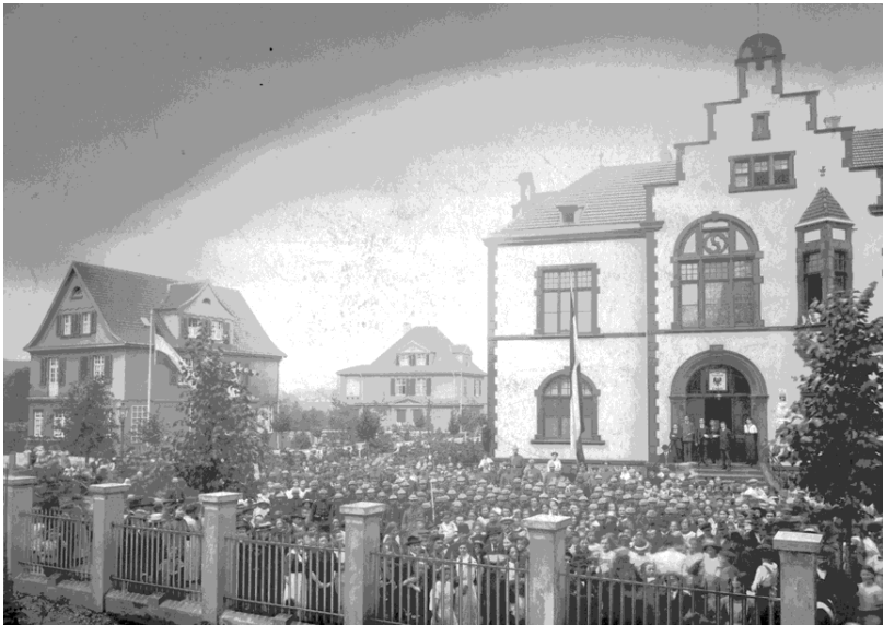
Soldaten und Bevölkerung vor dem Erkrather Rathaus.

Auch in Erkrath waren alle diese Probleme spürbar, wenn auch vergleichsweise weniger radikal als in den umliegenden Großstädten. Das lag nicht zuletzt an den Maßnahmen, die Bürgermeister Franz Zahren (1872 - 1930), seit 1907 im Amt, traf. Er sorgte für die Sicherstellung der Versorgung mit Lebensmitteln und Brennstoffen sowie für deren Finanzierung. Als Ersatz für einberufene Beamte und Angestellte der Gemeindeverwaltung wurden neue Arbeitskräfte eingestellt, darunter mehrere weibliche Hilfskräfte.