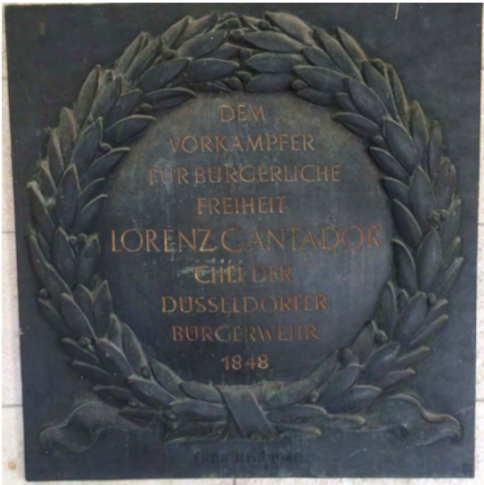
Gedenkplatte für Cantador gegenüber dem Rathaus Düsseldorf