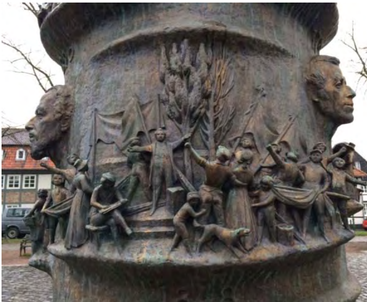
Brunnen am Gericusplatz: Die Revolution 1848