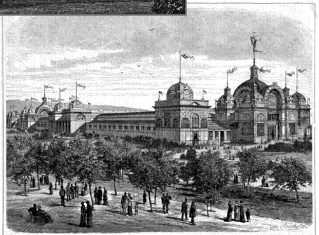
Gebäude der Gewerbe und Kunstausstellung Düsseldorf 1880