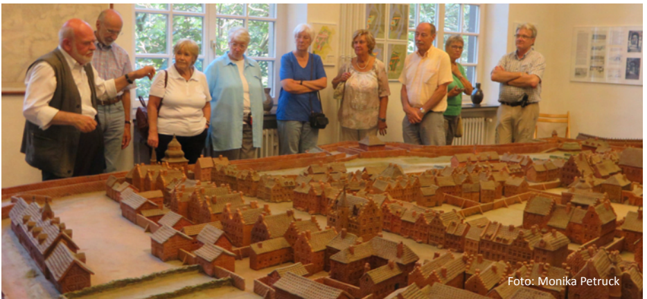
Modell des mittelalterlichen Kaiserswerth

Kaiserswerth 1300 Jahre, Festschrift, o.O. 1998