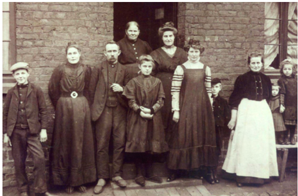
Glasmacher-Familie im Sonntagsanzug, Anfang 1900