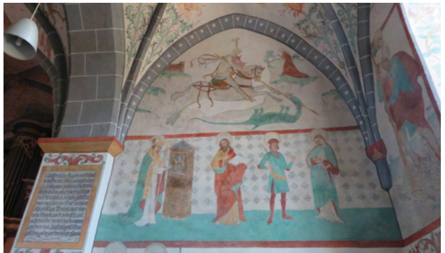
Monika Petruck - Lieberhausen

Die Kirche ist ursprünglich als romanische Kleinbasilika errichtet: Ein Turm im Westen, anschließend ein gleich großes Mittelschiff und zwei Seitenschiffe.