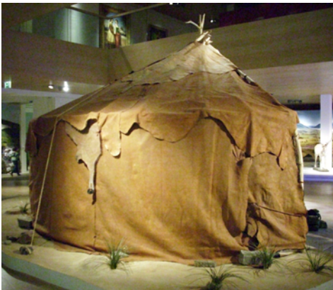
Jurte der Nomaden

Häuser werden wahrscheinlich erst von sesshaften Bauern errichtet, die dann auch die Keramik erfinden, mit der man besser kochen und Vorräte aufbewahren kann. Keramik ist für Nomaden zu schwer und zu empfindlich.