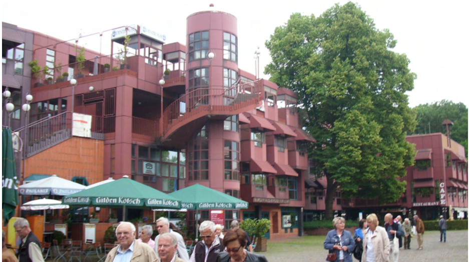
Bürgerhaus Bergischer Löwe