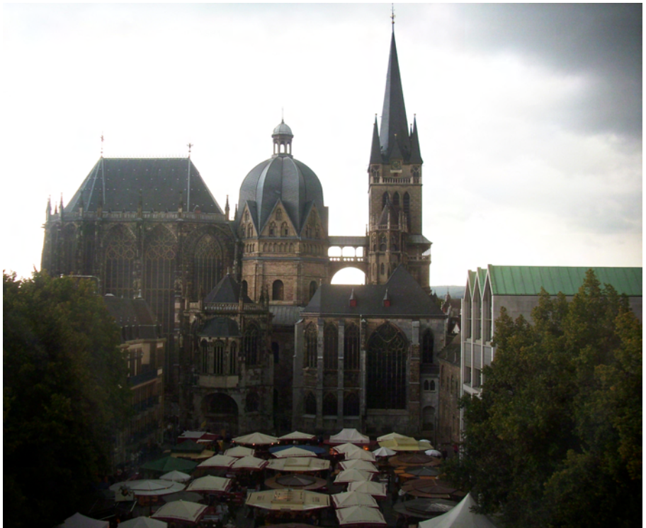
Dom Aachen

Anlässlich der Sonderausstellung zum Tod Karls des Großen vor 1.200 Jahren fahren wir mit 39 Teilnehmern nach Aachen. In drei Ausstellungen wird die Zeit Karls vor Augen geführt.