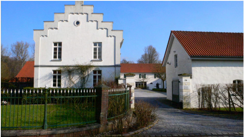
Haus Morp