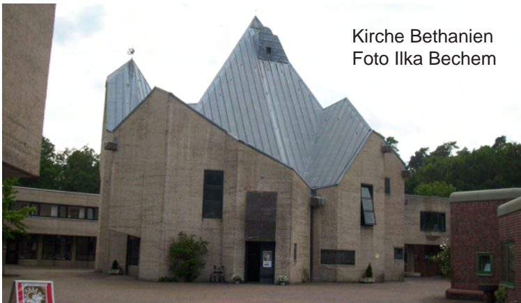
Kirche Bethanien