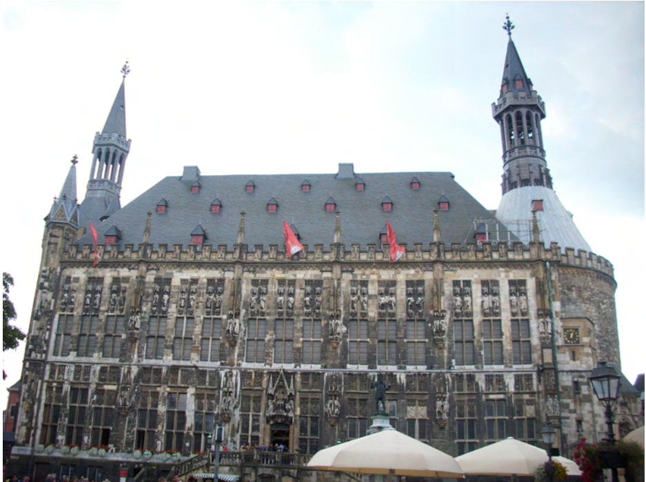
Rathaus Aachen

Unsere erste Station ist die Ausstellung „Orte der Macht“ im Rathaus. Frau Simon-Tönges und Herr Günay führen uns durch den 800 m 2 grossen Krönungssaal, in dem ausgehend vom Reisekönigtum der Karolinger es zur Struktur des mittelalterlichen West-Europas kommt. Eine herausragende Leistung von Karls Hofschule ist die Entwicklung der Schrift Karolingische Minuskel, die sich beim Kopieren alter Handschriften schneller und platzsparender schreiben lässt als die Vorgängerschriften, und die heute noch in den Antiqua-Schriften präsent ist.