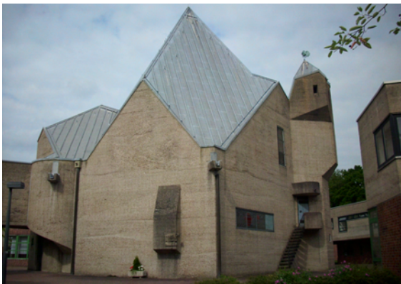
Rathaus Bensberg